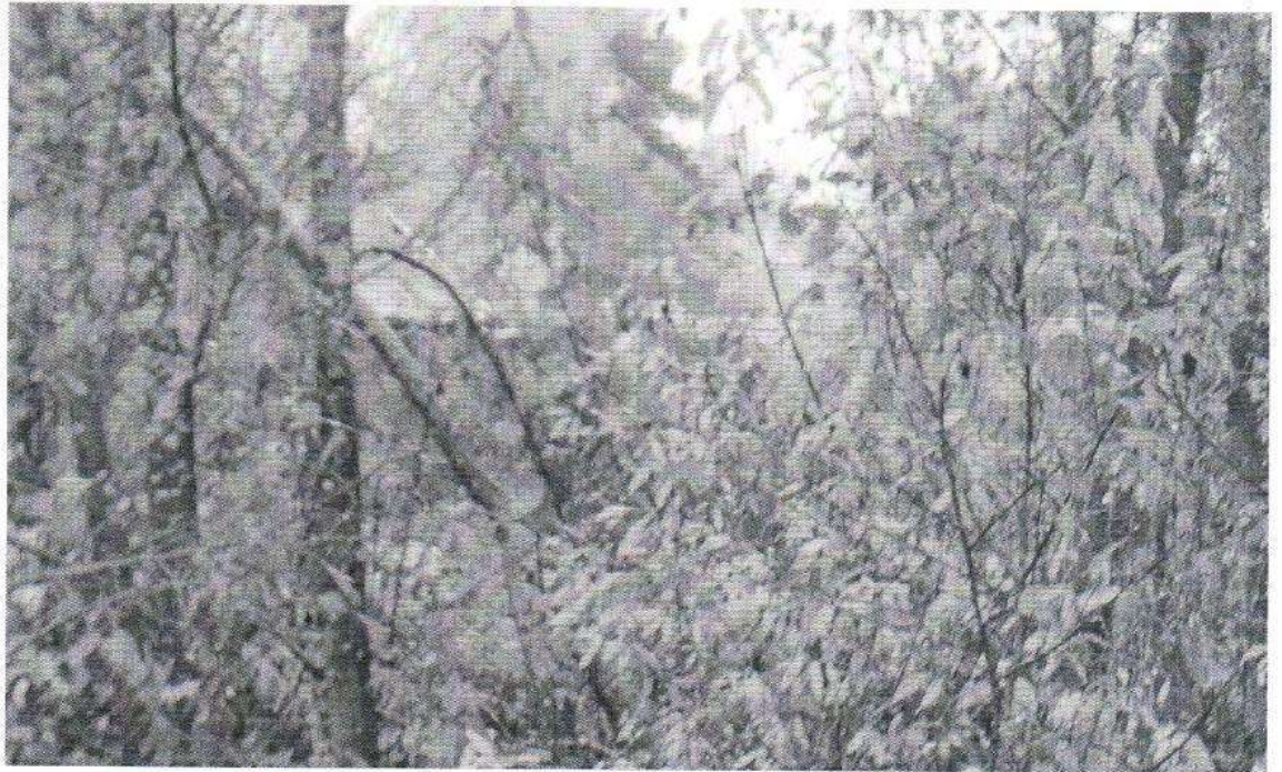
Земельный участок 50:01:0050214:308 МО Талдомский район п. Запрудня, ул. Кооперативная